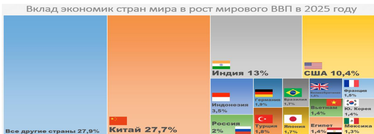
Рис.3. Прогнозные данные вклада стран мира в рост мирового ВВП (2025г.).

Парижское соглашение, как известно, не разделяет своих участников на развитые и развивающиеся страны, что, на наш взгляд, поднимает серьезный вопрос: а кем является Россия? В зависимости от того, кем себя считает Россия и кем ее считает мировое сообщество, будет формироваться ее роль и функции в рамках Парижского соглашения. Как можно было заметить, роль развитых, развивающихся и наименее развитых стран в договоре разительно отличается. В связи с этим при отсутствии возможности точного определения России к одной из категорий возникает проблема выбора ее подхода к выполнению Парижского соглашения (Рис.3).