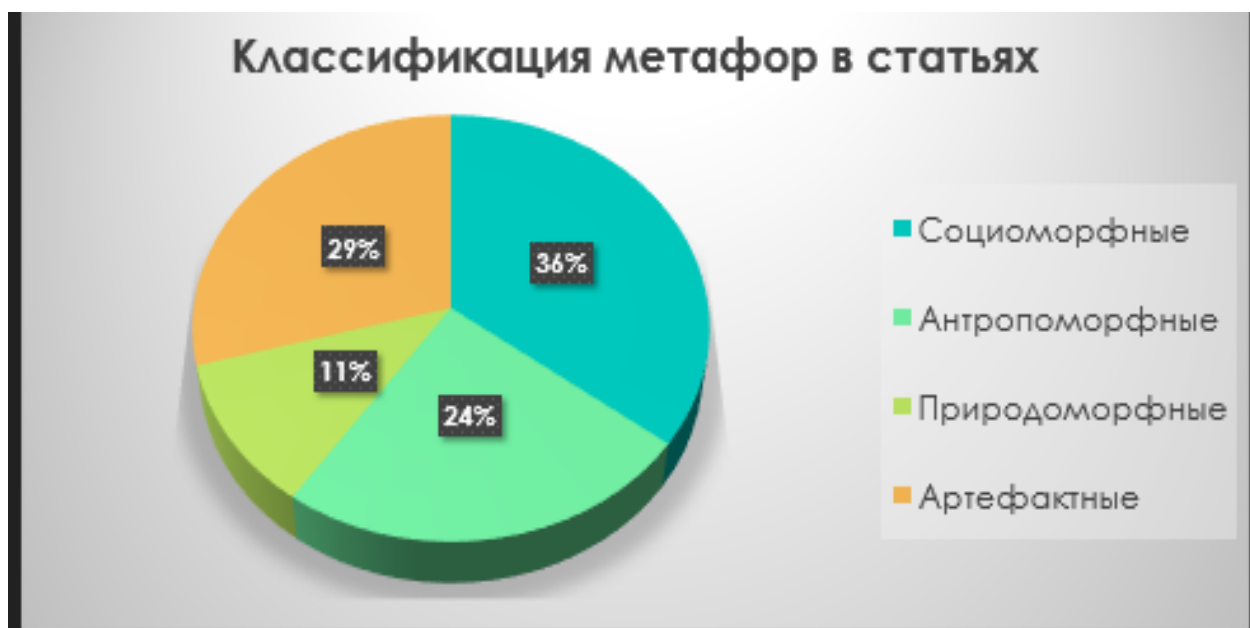
Рис.1. Количество метафорических высказываний и их процентное соотношение (составлено авторами)

Общий анализ всего имеющегося текстового материала трех статей показал следующие результаты, которые представлены в графическом виде (рис. 1).