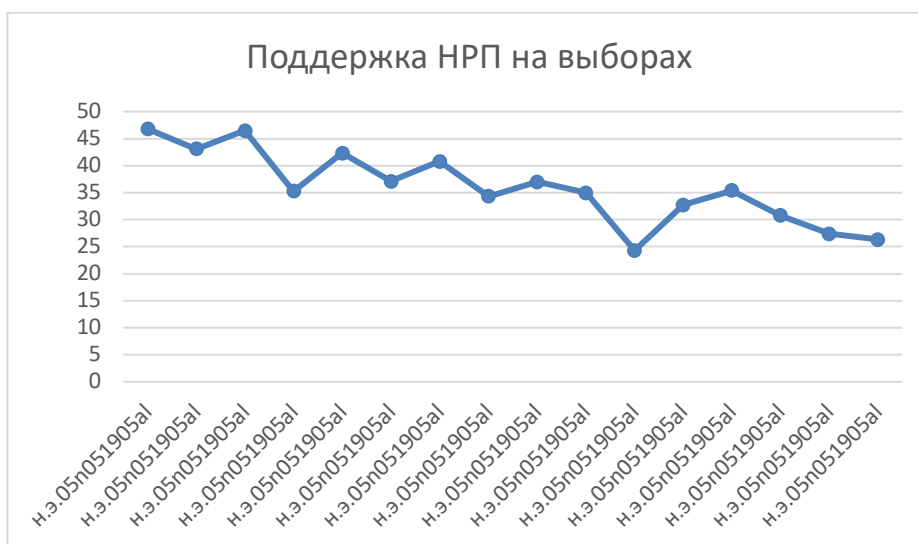
Таблица 1. Уровень поддержки населением Норвежской рабочей партии 1961–2021 гг. График составлен по данным сайта Poll of polls // Pollofpolls.no. Available at: http://www.pollofpolls.no/?cmd=Stortinget (Accessed: 09.02.2022).

позволяло ей практически в одиночку формировать правительство и принимать решения в парламенте. График также показывает, что на протяжении длительного временного промежутка (60 лет) партия имела стабильно высокие результаты на выборах, получая около трети или даже больше голосов избирателей. В сентябре 2021 г., после восьми лет правления правой коалиции, НРП вновь одержала победу, получив 26,3% голосов.